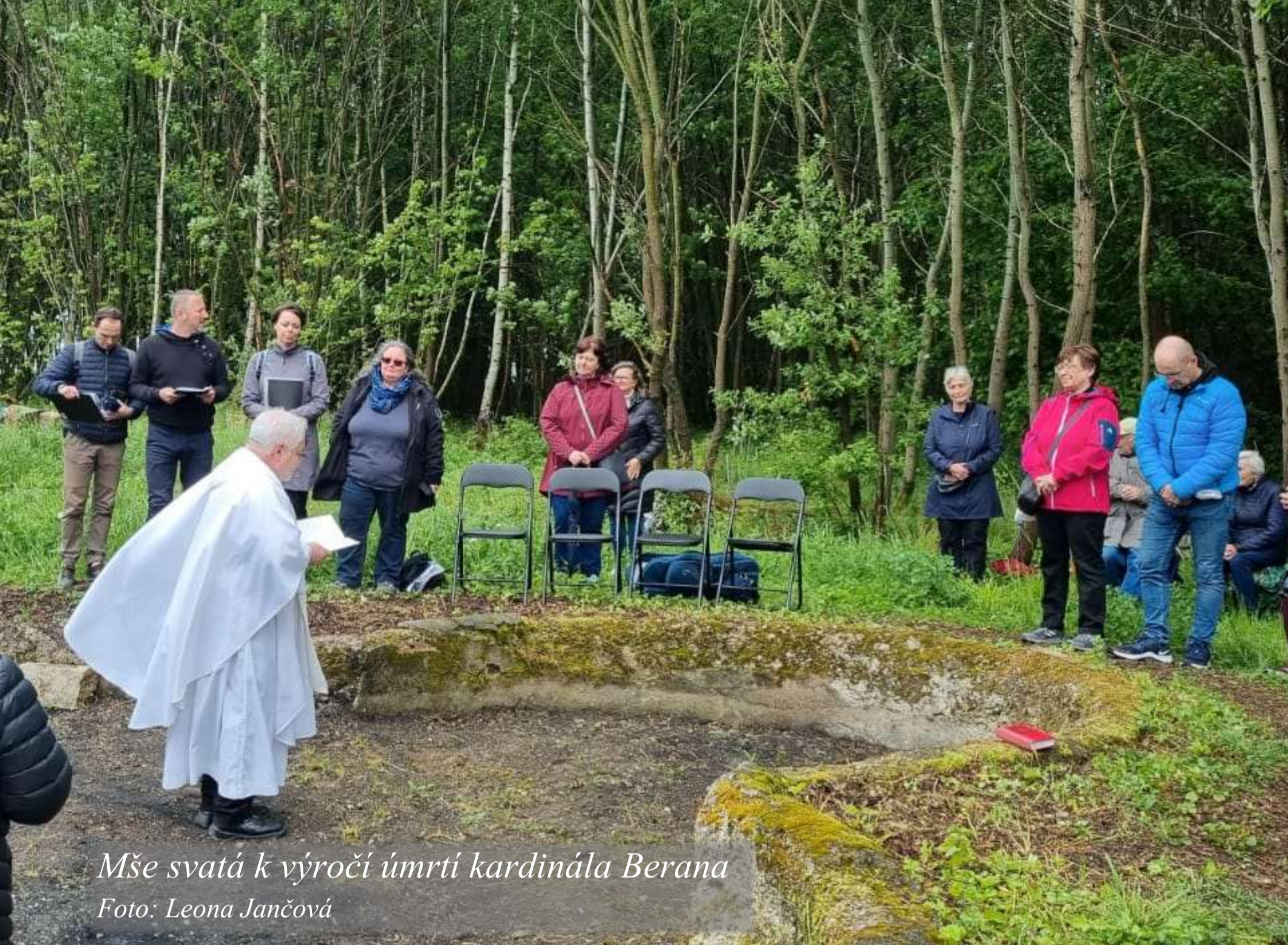
Mše svatá k výročí úmrtí kardinála Berana