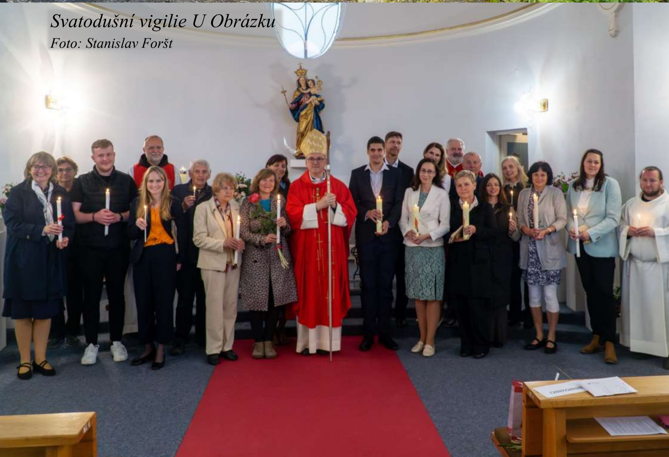
Svatodušní vigilie U Obrázku