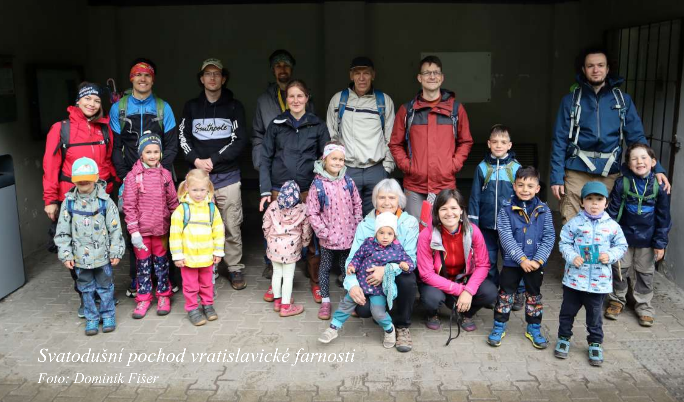
Svatodušní pochod vratislavické farnosti